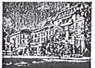
Hotel in der Kurstadt Bad Reichenhall