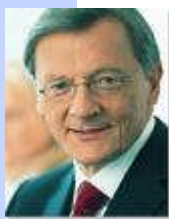
Dr. Wolfgang Schüssel Bundeskanzler a.D. Abgeordneter zum Nationalrat