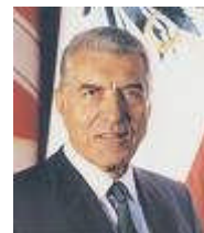
Prof. Dr. Helmut Zilk † Ehemaliger Landes- hauptmann und Bürger- meister von Wien Bundesminister für Unterrecht und Kunst a.D.