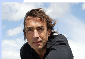
Hubert von GOISERN Liedermacher und Weltmusiker