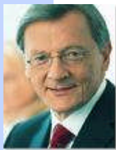
Dr. Wolfgang Schüssel Bundeskanzler a.D. Abgeordneter zum Nationalrat