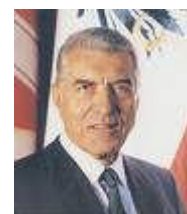
Prof. Dr. Helmut Zilk † Ehemaliger Landes- hauptmann und Bürger- meister von Wien Bundesminister für Unterrecht und Kunst a.D.