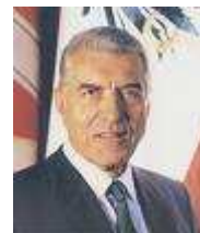
Prof. Dr. Helmut Zilk † Ehemaliger Landes- hauptmann und Bürger- meister von Wien Bundesminister für Unterricht und Kunst a.D.