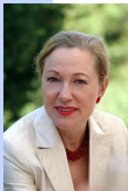
Dr. Benita FERRERO-WALDNER EU-Kommissarin für Außenbeziehungen und europäische Nachbarschaftspolitik a.D.

Ich unterstütze die Zielsetzung des Instituts der Regionen Europas (IRE) und erkläre mich einverstanden, Mitglied des „Board of Patrons“ zu sein.