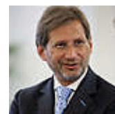
Dr. Johannes HAHN EU-Kommissar für Regionalpolitik