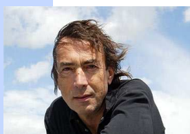
Hubert von GOISERN Liedermacher und Weltmusiker