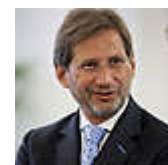
Dr. Johannes HAHN EU-Kommissar für Regionalpolitik