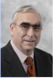
Dr. Theo Waigel Bundesminister für Finanzen a.D., Deutschland