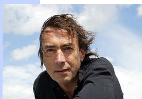
Hubert von GOISERN Liedermacher und Weltmusiker