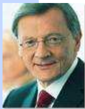
Dr. Wolfgang Schüssel Bundeskanzler a.D. Abgeordneter zum Nationalrat