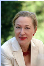
Dr. Benita FERRERO-WALDNER EU-Kommissarin für Außenbeziehungen und europäische Nachbarschaftspolitik

Ich unterstütze die Zielsetzung des Instituts der Regionen Europas (IRE) und erkläre mich einverstanden, Mitglied des „Board of Patrons“ zu sein.