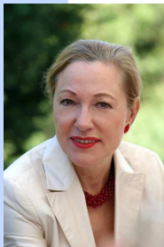
Dr. Benita FERRERO-WALDNER EU-Kommissarin für Außenbeziehungen und europäische Nachbarschaftspolitik

Ich unterstütze die Zielsetzung des Instituts der Regionen Europas (IRE) und erkläre mich einverstanden, Mitglied des „Board of Patrons“ zu sein.